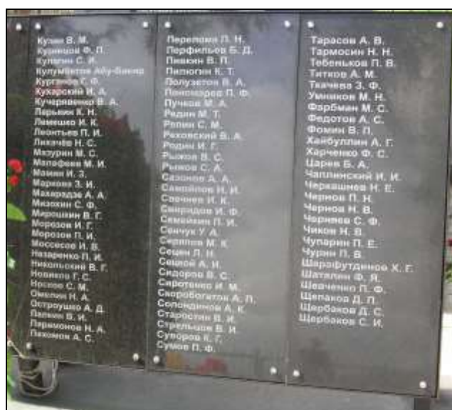
Памятная плита на братской могиле, где увековечены имена девушек из полка УНКВД