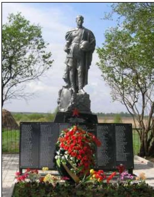
Братская могила на восточной окраине д. Василево

Вблизи села Рогачево, на окраине деревни Василево, и на территории бывшей воинской части восточнее этой деревни, находятся братские могилы, где похоронены бойцы соединений 30-й армии, павшие при штурме Рогачевского оборонительного узла 6-8 декабря 1941 г. Однако на памятных плитах можно обнаружить фамилии людей, служивших совсем в других частях. Помимо бойцов, умерших в госпиталях, здесь увековечены и бойцы истребительного мотострелкового Московского полка Управления Народного комиссариата внутренних дел по г. Москве и Московской области (далее — полк УНКВД).