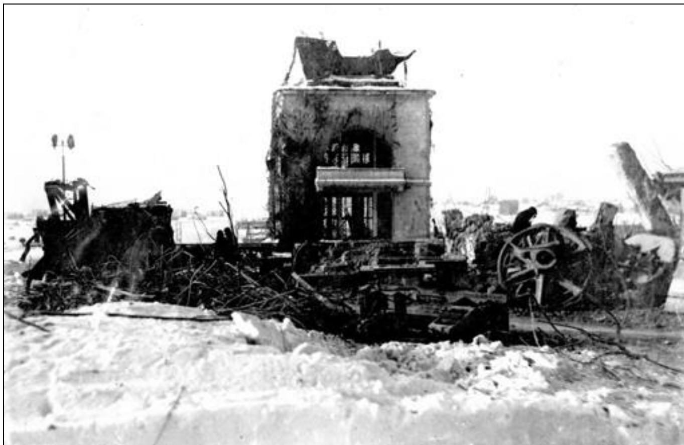
Взорванный шлюз №3

«Ночью 30 ноября, наш подрывник, взорвал правые башни шлюза №3 и шоссейные мосты Яхромский и Дмитровский и получил за это орден «Красной Звезды» 9 .